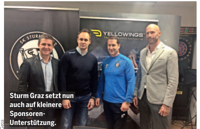
Sturm Graz setzt nun auch auf kleinere Sponsoren-Unterstützung.

Auch in Kumberg ist eine vierköpfige Familie aus dem Irak von der Abschiebung nach Kroatien bedroht – hier läuft ein Europa-Verfahren.