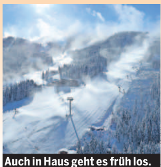
Auch in Haus geht es früh los.

Haus im Ennstal. Derzeit läuft die Beschneigungsanlage mit 200 Schneekanonen bei minus 8 Grad am Berg auf Hochtouren – Skistart am Hauser Kaibling ist am Freitag, dem 18. November, somit fix.